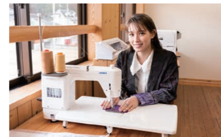
職業用直線本縫いミシン 皮革や帆布など厚手の生地も縫えます

裁縫などをミシンを使ってしたい方にオススメです。これから寒い季節に、お仲間が集まって、縫い物でもするのはいかがでしょうか。古い着物や布の端材等を無料で提供中です。 またオリジナルのエコバッグやTシャツの作成もできますよ。