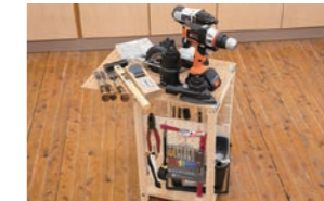
木工ツールセット