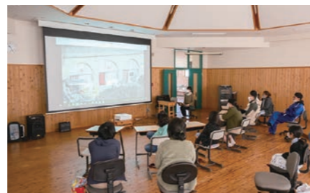
スクリーン、プロジェクター