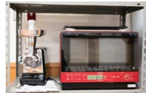
ミキサーとオーブン