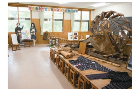
里山めぐる展では、京都市北部山間地域の伝統文化の展示をしています