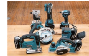
有料マキタツールセット

丸ノコ、インパクトドライバー、マルチツール、トリマー、電動カンナ、ジグソー、サンダー ※1工具300円/日