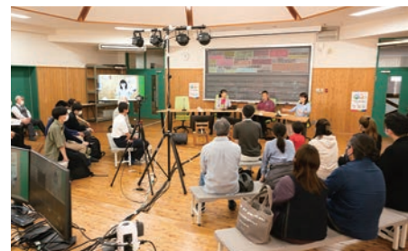
ライブ配信の様子

動画の撮影やライブ配信する機材が一式揃っています。広告用の動画などを制作いただけます。 音楽関係のイベントや、大きなスクリーンとプロジェクターも揃っていますので、 講演会や映画の上映会などを開催することも可能です。