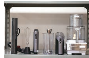
低温調理器、ミキサー、ブレンダー