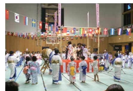
10月22日は、京北盆踊りフェスタが、元京北第一小体育館で開催されます

親子でめぐる伝統文化体験教室は、市街地などからも親子連れが参加される予定です。見学やVR体験は自由にできます。ことすは京都市北部山間地域の伝統文化を身近に楽しめるイベントの企画・運営に協力しています。