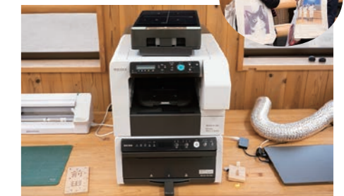
ガーメントプリンター オリジナルエコバッグが作れます 料金は白黒300円、カラー600円、 印刷用の無地エコバッグもあります(100円~)