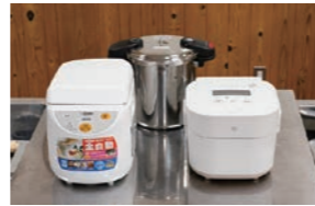
餅つき機、圧力鍋、炊飯器